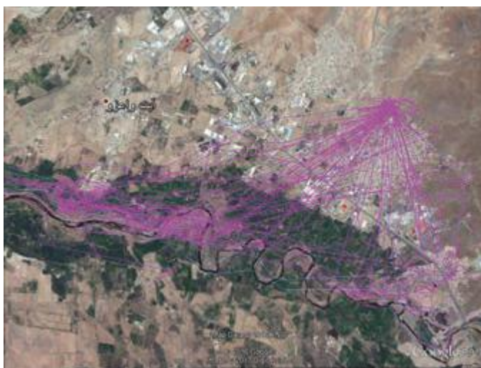
Bewegungsmuster der Senderstörchin „Vroni“ im Januar 2016 bei Marrakesch, Marokko.