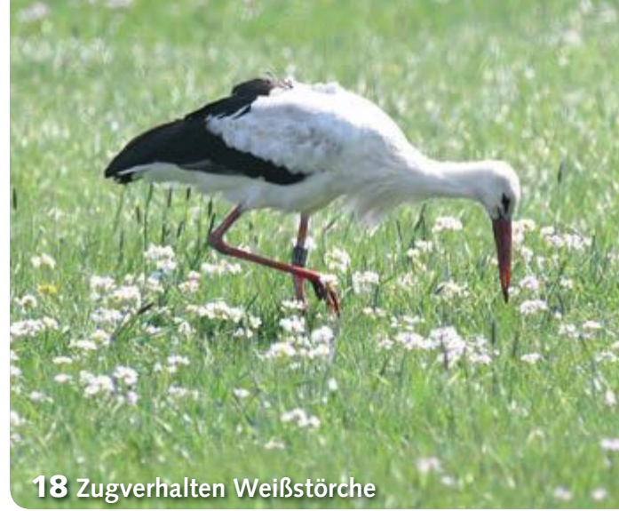
18 Zugverhalten Weißstörche