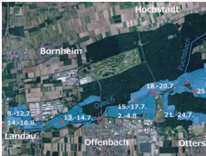
Durch die zeitlich versetzten Wässertage „wandern“ die Überschwemmungsflächen an der Queich.